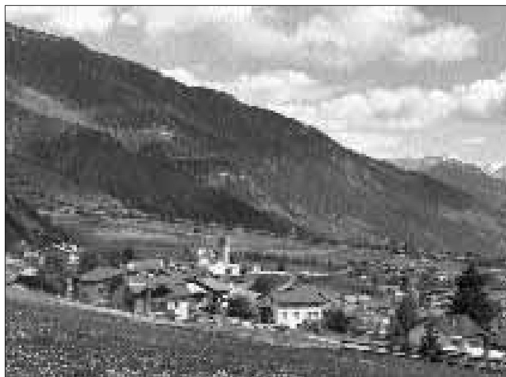
La Val Müstair che ha fatg el decurs dals davos 25 onns in svilup exemplaric.

Cun 1700 abitants fiss ina vischnanca Bergiaglia fusiunada classifitgada en la categoria da vischnancas da 1000 fin 3000 abitants. Sia dimensiun fiss cumparegliabla tranter auter cun las vischnancas da Puschlav, Brusio, Punttraschigna, Mustér, Tujetsch, Sumvitg, Mesauc u Roveredo. Cun 2396 francs entradas da taglia per persuna fiss sia forza fiscala en la media grischuna. Cun applitgar in pe da taglia unifitgà da 95 fin 100 pertschient da la taglia chantunala simpla fiss la vischnanca a la sava tranter las gruppas da forza finanziaia dus e trais. Decisiv per la classificaziun da la forza finanziaia dastgass esser il svilup futur da las taglias sin ovras electricas. Ina reuniun da las bilantschas (1997) da las tschintg vischnancas avess per consequenza ina buna situaziun da partenza (basa d'agen chapital sufficienta da 2944 francs per persuna; praticamain nagina debitaziun). In potenzial da spargn fiss da sondar tar l'administraziun.